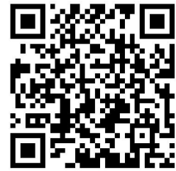
财政权力事项清单