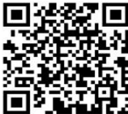
1.会计师事务所设立审批